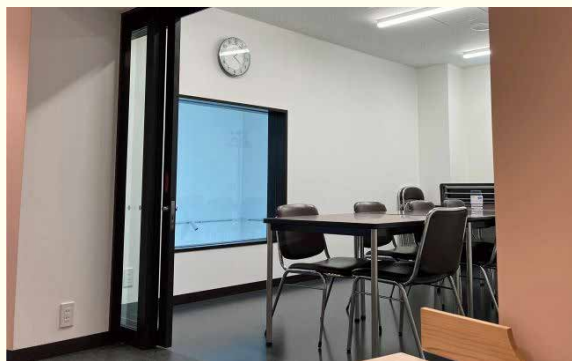
図上 2階 集会室1

今井館は4階建てで、1階には今井館の事務室、閲覧室、書庫があり、2階には聖書講堂、集会室1, 2, 3があります。集会室2, 3は仕切りを取ると中集会室として利用できます。3～4階には賃貸住宅があり、1LDKが4部屋、ワンルームが2部屋あります。