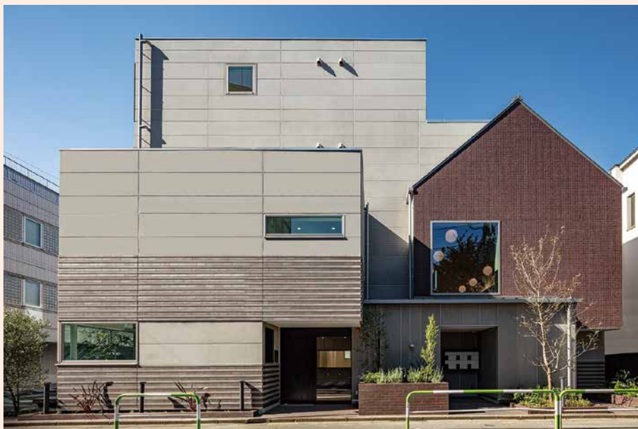
新今井館正面(撮影:浅川敏氏)